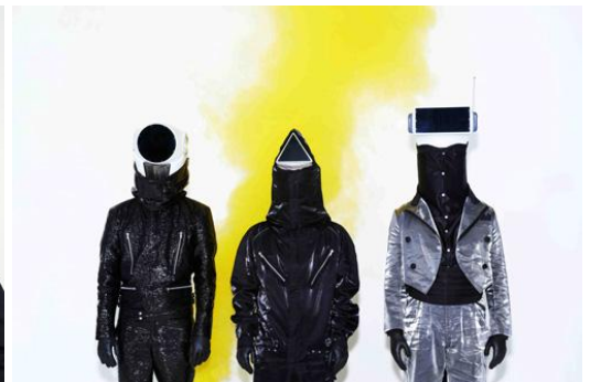
< CTS >