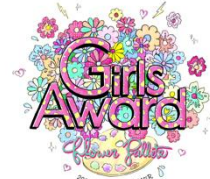
GirlsAward 2014 S/S キービジュアル

今回のシーズンテーマは『FLOWER PALLET』。 春の色は、花の色。パレットに絵の具を落としていくように、 鮮やかなつぼみが幕を開け、あたたかな風とともに、大地に色をつける… そんな花たちは、自然から生まれた、わたしたちへのGIFT。 この春、GirlsAwardから皆さんに、最高のGIFTをお届けします！