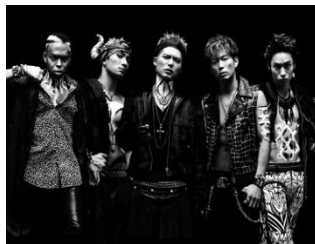
<THE SECOND from EXILE>