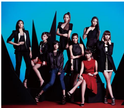
< Flower >