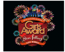
GirlsAward 2015 AUTUMN / WINTER メインビジュアル

開催日時：2015年10月24日(土) 開場：12:30 / 開演 14:00 / 終演 21:00 (予定)